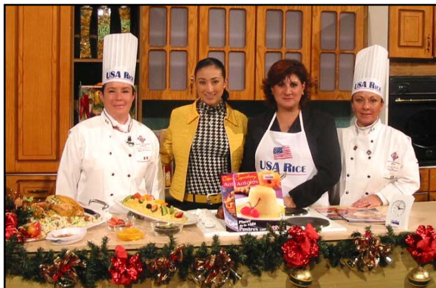
Televisora Mexiquense Toluca

USA Rice conduce una serie de programas de televisión desde diferentes ciudades de la república con el fin de enseñar a las amas de casa nuevas recetas y también a conocer las diversos tipos y variedades de arroz.