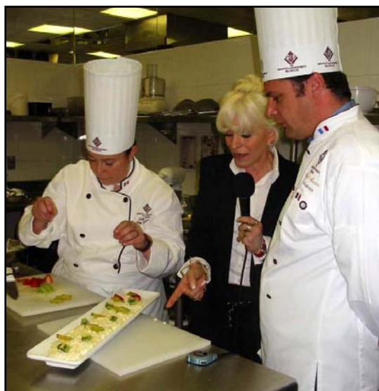
Chefs del Instituto Gastronómico Belinglise

Gracias a estos programas las amas de casa de toda la república están enriqueciendo sus conocimientos sobre el arroz y aprendiendo a preparar nuevas recetas.