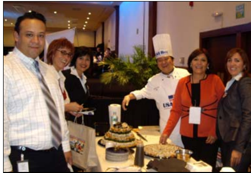
USA Rice sushi en la expo del medio ambiente