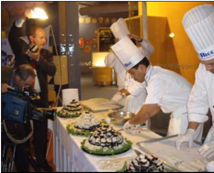
Recepción en el IMAX