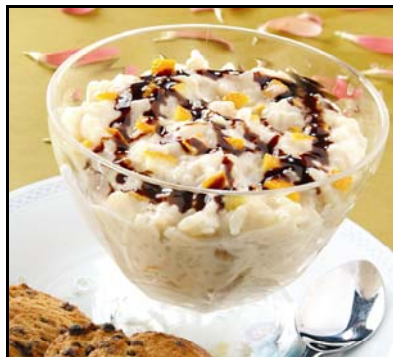
Postre con arroz de grano mediano