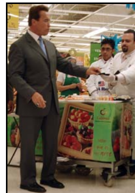
Gobernador probando sushi